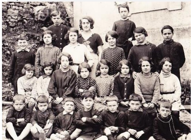
L'école en 1934 : qui reconnaissez-vous ?